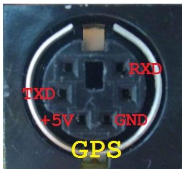
passend für Haicom HI-204 ohne Zwischenkabel